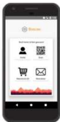
Scannen mit Buscan