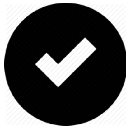
Ware überprüfen und bestellen